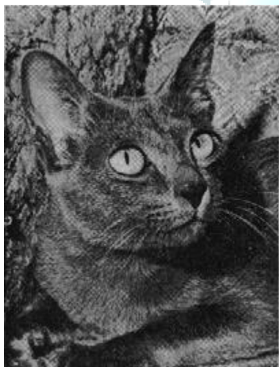
Ma-dee of Si-K'iu

В наше время наибольшая популяция этих кошек приходится на США, в Европе мало распространена, однако их разведением занимаются и во многих других странах.