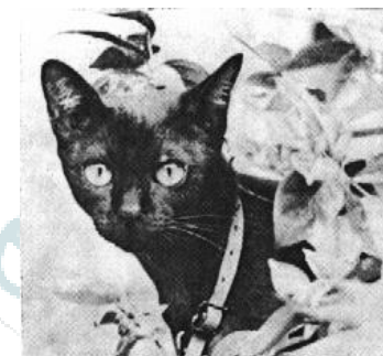
Supalak, Thong-Daeng or "Copper" Cat

У себя на родине Кораты имеют особую ценность, так как с ними связано множество традиций и верований. К примеру, там их не принято покупать или обменивать, а лишь отдавать в качестве подарка. Так, отдельной традицией считается подарок Кората молодоженам в день свадьбы, дабы укрепить их брак и принести в дом благополучие