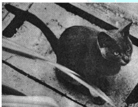
Mahajaya Ling Dum

Корат — одна из древнейших пород домашних кошек, первые упоминания о ней можно найти еще в старинной рукописи «Стихи о кошках» (1350 — 1767 г.). Название своей породы получила от владыки Сиам (нынешний Таиланд) Рама V, который получил её в качестве подарка. Когда же он спросил, что это за кошка, ему ответили лишь то, что её к нему доставили из высокогорной провинции Корат. Так, недолго думая, эта порода и получила свое название.