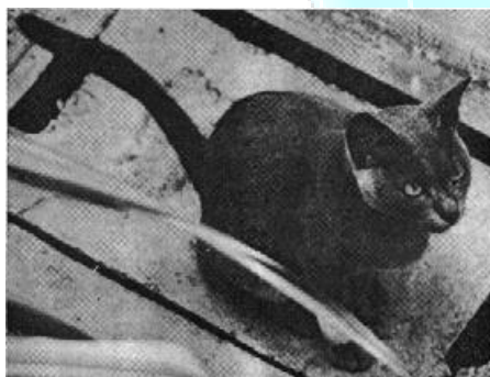
Mahajaya Ling Dum

Корат — одна из древнейших пород домашних кошек, первые упоминания о ней можно найти еще в старинной рукописи «Стихи о кошках» (1350 — 1767 г.). Название своей породы получила от владыки Сиам (нынешний Таиланд) Рама V, который получил её в качестве подарка. Когда же он спросил, что это за кошка, ему ответили лишь то, что её к нему доставили из высокогорной провинции Корат. Так, недолго думая, эта порода и получила свое название.