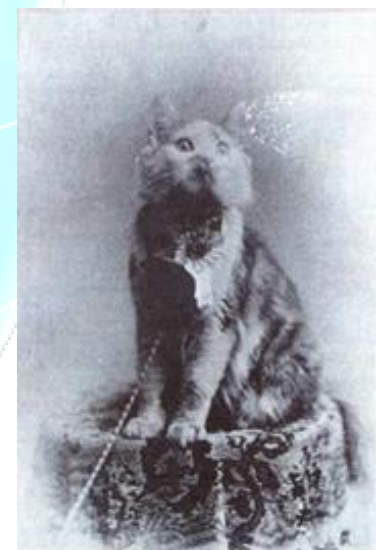
NATIONAL CAT SHOW 1895 WON BY COSBY.