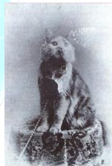
NATIONAL CAT SHOW 1895 WON BY COSBY.