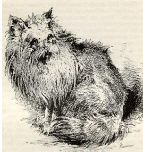
Nebelung 1889 - drawing by Harrison Weir

Нибелунг — это достаточно молодая порода, которая получила признание лишь в 80-х годах 20 века. История ее происхождения неразрывно связана с породой Русская голубая. Выведение Нибелунгов произошло двумя путями: европейским и американским.