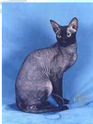
Malen'kiy Monya of Wavorgonaked, PBDd23, male

Мутации происходят постоянно. Мир стремительно меняется и, чтобы выжить, живые организмы должны изменяться, приспосабливаться, одним словом - мутировать. Бесшерстные животные периодически появлялись и появляются у разных видов. Судьба их в большинстве случаев плачевна: незащищенные от окружающей среды (имеется в виду комплексное понятие), они быстро гибнут. Иная судьба может ожидать таких "голеньких", если они появляются у домашних животных, находящихся под покровительством и контролем человека. Если новое свойство не противоречит их хозяйственному использованию или хотя бы вызовет любопытство, его носители могут быть отобраны для дальнейшего разведения и даже иногда попасть в число привилегированных любимцев.