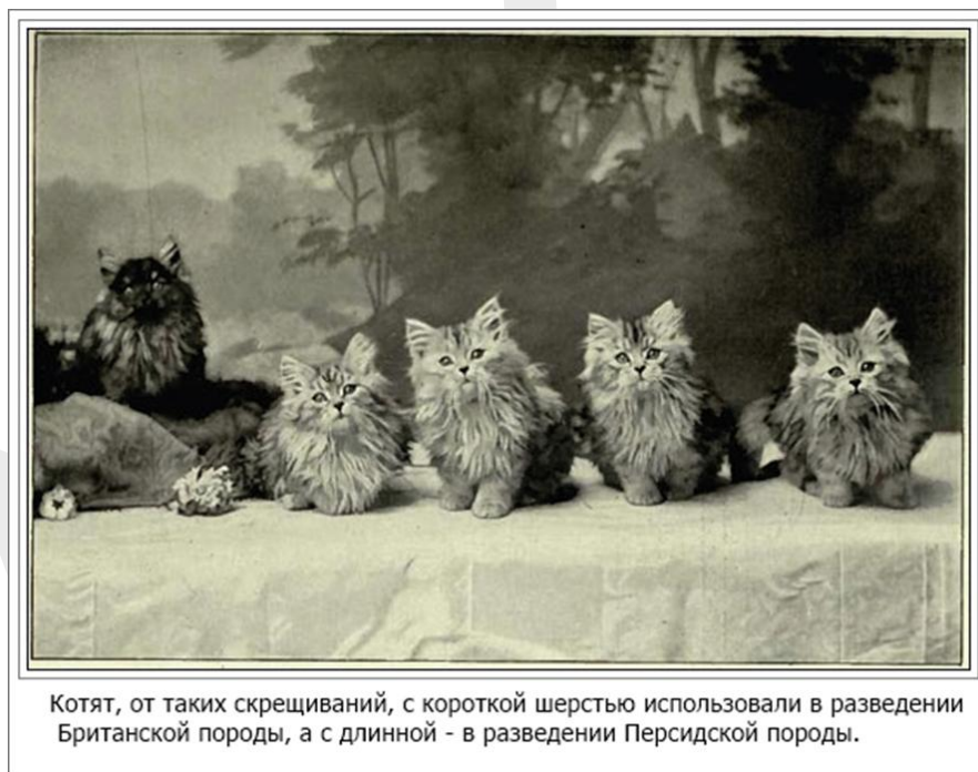
Котят, от таких скрещиваний, с короткой шерстью использовали в разведении Британской породы, а с длинной - в разведении Персидской породы.

Второй этап вливания Персидской породы на Британскую породу произошел после второй мировой войны, когда были уничтожены многие достойные представители различных пород кошек. Данные вязки были просто неизбежны для восстановления многих пород. Британская длинношерстная, в то время как порода не развивалась.