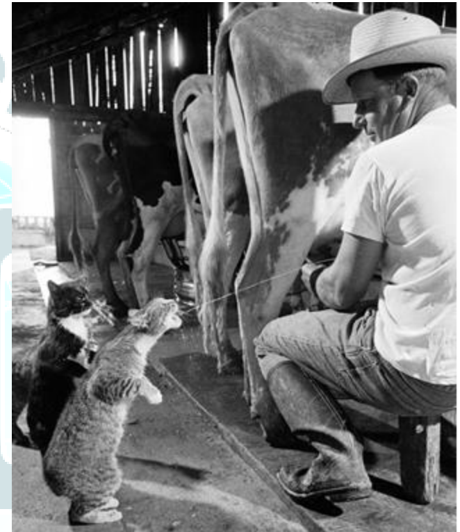
Кошки мэнкс во время доения коров на молочной ферме, 1954 год.

Невозможно предсказать, какие котята будут в помете, даже при вязке рампи и рампи. Так как вязка рампи в течение трех-четырех поколений приводит к генетическим дефектам у котят, то большинство заводчиков использует в работе все типы кошек. К показу на выставках допускаются только те представители породы, которые относятся к первому типу. Остальные участвуют в разведении.