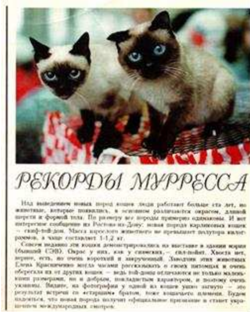
№ 4 (42), апрель 1994 г.